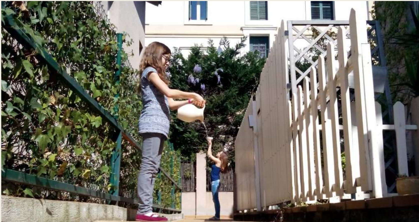
“Thales assedegat” 2 ESO