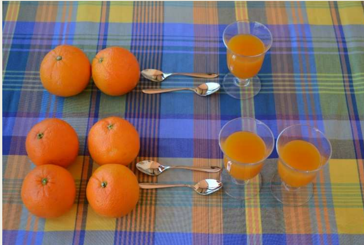
“Suc directament proporcional” 2 ESO