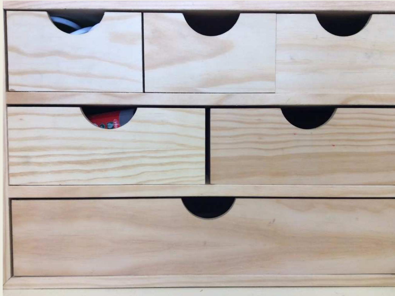
“Mitjos i terços” 1 ESO