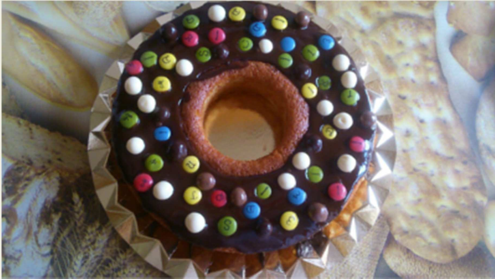
“Un zero molt dolç” 1 ESO